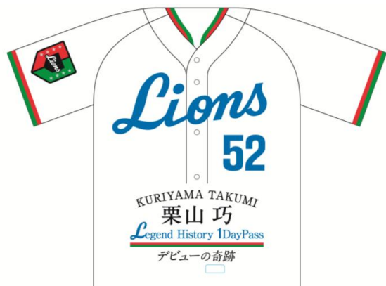
オリジナル台紙 表紙イメージ